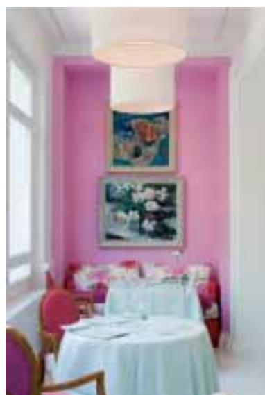
Un angolo della sala ristorante.

Passeggiano nei vigneti parlando ai viticoltori, chiacchierano nei mercati di frutta e ortaggi, nei mercati di pesce e della carne. Leggono e studiano molto (in particolare, sui testi dell'antica Università di Portici studiano i tremila anni di storia del vino e del cibo del Sud), ma soprattutto "vivono" le diverse realtà che incontrano. Scavano in quelle radici e capiscono, avendone conferma ovunque, la verità fondamentale: ubbidisci alla terra ed essa ti servirà senza tradirti.