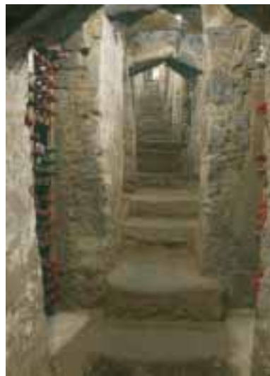
Le scale della cantina in tufo e pietra vesuviana.