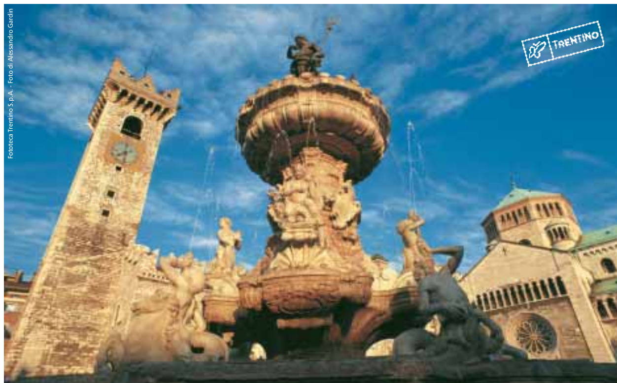
La splendida piazza Duomo a Trento con la fontana del Nettuno.

Per informazioni: www.enotourtrento.it - info@enotourtrento.it